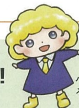
パート・有期法イメージキャラクター 「ばゆうちゃん」

正規社員と非正規社員の待遇に違いがある場合は、待遇の違いが働き方や役割の違いに応じたものであると説明できますか？