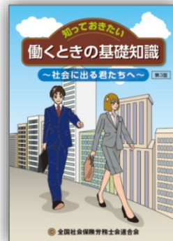
全国社会保険労務士会連合会発行 出前講座用教材「働くときの基礎知識」

「話を聞いて、私もコミュニケーションが上手になりたいと思いました。」 「社会に出たら、いろんなルールやマナーが必要なんだな、と思いました。」 「将来、人の役にたてるような大人になりたいなと思いました。」